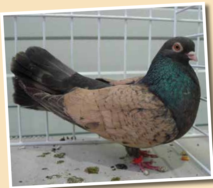
Capitombolante rumeno Orbeteni pietrascura a scudo giallo