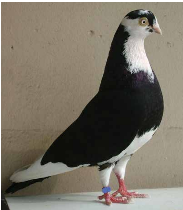
Rotolatore di Galati

il particolare color ruggine degli scudi alari, si alleva con disegno a mezzaluna o con intero collare bianco. Il Capitombolante di Calarasi è una vecchia razza che vola molto alta e rotola scendendo, ma solo per poco tempo. Ha becco corto e corpo piccolo, e la testa è ornata di ciuffo. Il Capitombolante rumeno pica barbuto è una razza famosa anche all'estero, allevata anche in Italia, caratteristico è il suo disegno di pica con barba bianca e leggere calze sulle zampe. Il Capitombolante di Costanza è una razza antica originaria della regione del Mar Nero, ha becco corto, fronte alta e testa ornata da ciuffo. E' un colombo grazioso e molto vivace, mantiene ancora l'attitudine di rotolare. Il Rotolatore di Galati è la