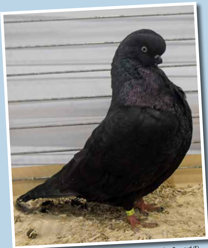
Capitombolante Inglese a faccia lunga nero M pt 96 di Jordan Bernard (F) Metz 2012