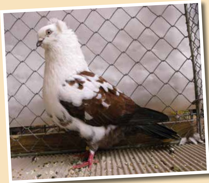
Pezzato di Timisoara ramato M pt 96 di Werner Hartmann, 4. Deutsche Tümmelerschau