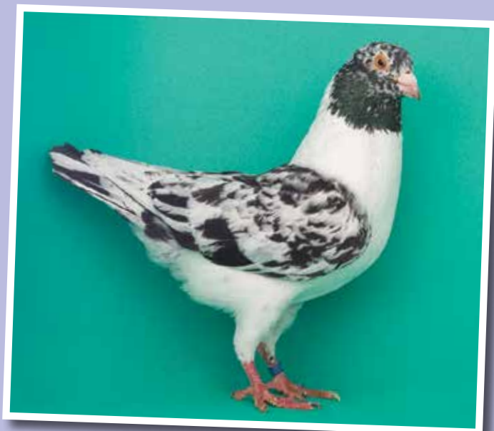
Triganino Modenese gazzo magnano di nero collezione Reggiani