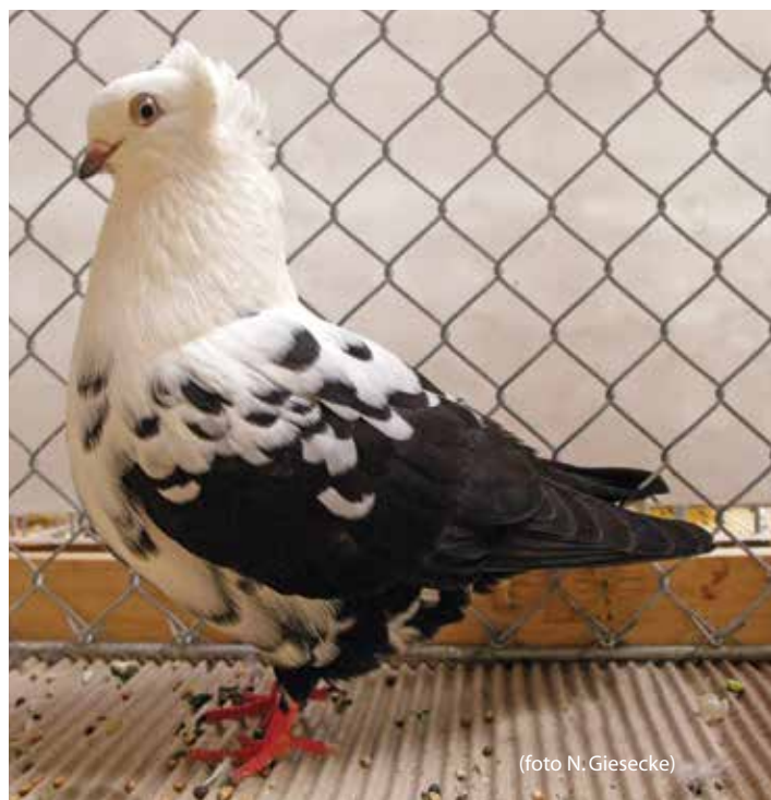
Pezzato di Timisoara nero M pt 96 di Uwe Schneider, 4. Deutsche Tümmelschau

La chiusura politica dell'Europa dell'est ha per decenni impedito ogni contatto con l'occidente, addirittura ostacolato gli scambi tra Paesi stessi assoggettati al patto di Varsavia. Si sono create quindi razze di colombi derivanti da un modello comune importato durante l'Impero Ottomano, che però, essendo isolate in regioni, province o addirittura vallate, sono state selezionate in modo diverso dando vita a razze che, più che essere tali, sembrano solo varietà