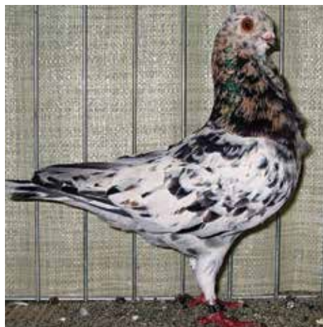
Fig. 1: Cravattato Italiano magnano

Tra le razze italiane è presente ufficialmente nel Sottobanca, nel Reggianino, nel Bergamasco e nel Triganino Modenese. In quest'ultima razza non è da escludere che alcuni soggetti definiti magnani siano il risultato di una variante diversa e non