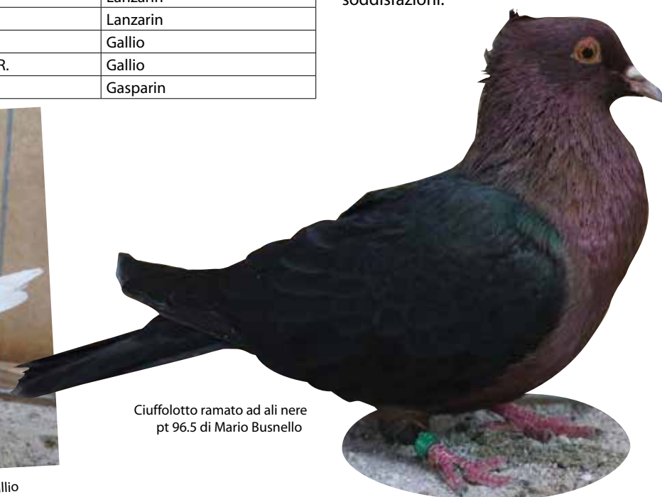
Ciuffolotto ramato ad ali nere pt 96.5 di Mario Busnello