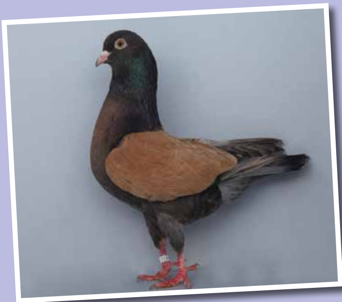
Triganino Modenese schietto dorato collezione Belucchi