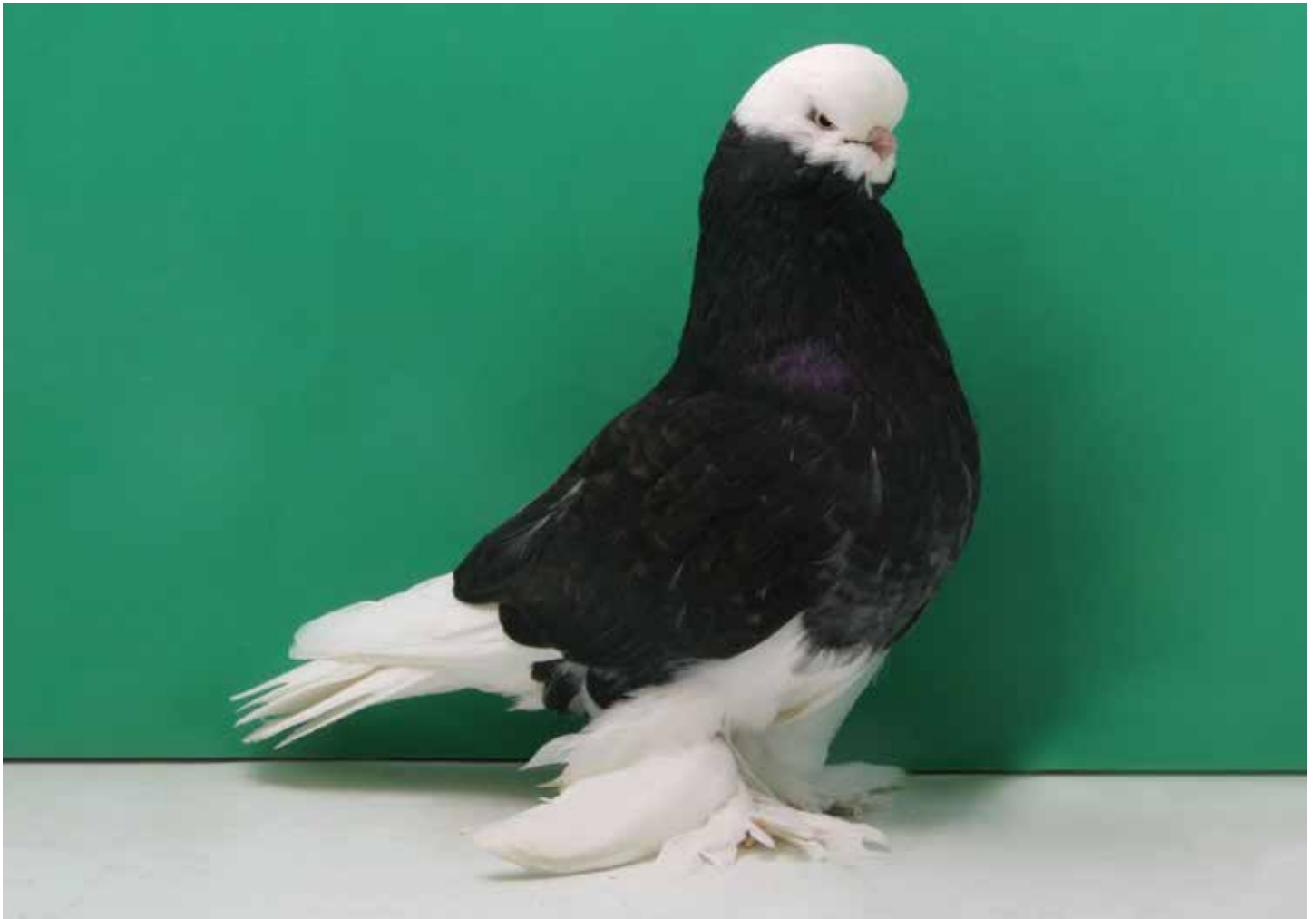
Capitombolante Inglese a faccia lunga a tarsi impiumati a testa bianca kite di Felice Esposito - Australia

allungata; di grande importanza è anche la rapida discesa della nuca nel collo portato verticale. La visione frontale deve mostrare un buon sviluppo delle guance sotto gli occhi, caratteristica importantissima per creare quella faccia piena e arrotondata che ti aspetti da un "faccia lunga".