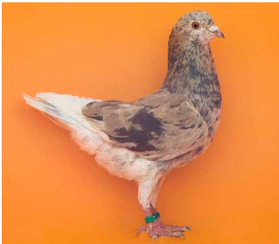
Triganino Modenese schietto magnano di monaro con pezza collezione Trompetto