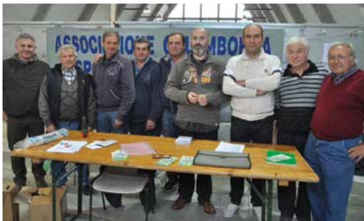
Gli allevatori dell'Ass. Veronese