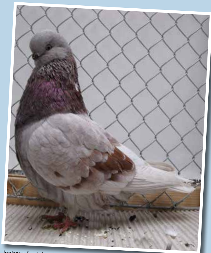
Inglese a faccia lunga rosso vergato F pt 96 di Horst-Dietrich Müller - Germania