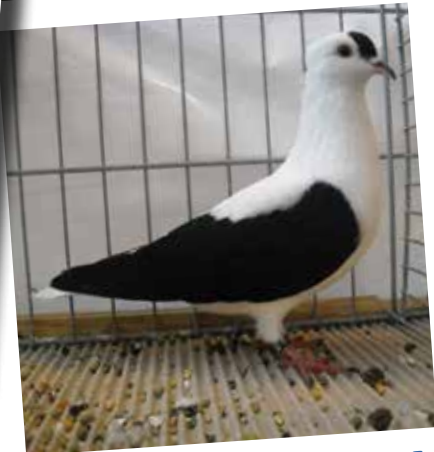
Colombo di San Gallo ad ali colorate nero F pt 95 di Uebersax Christoph - CH