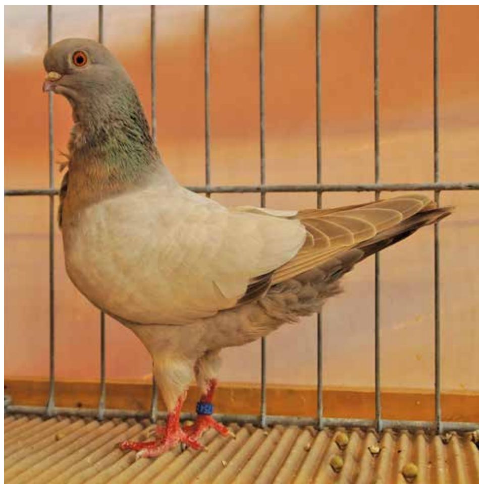
Cravattato Italiano Reggianino blu argento senza verghe a petto d'oro F pt 95 di Ferdinand Hügi

Questa esposizione ha ribadito la diffusione significativa del Cravattato Italiano in Europa. Il Club svizzero ha fatto tutto il possibile per garantire agli allevatori ed ai loro colombe il massimo, in modo che il futuro trionfo della razza e del Club continui al meglio.