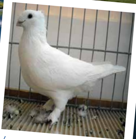
Lucernese unicolore bianco M pt 91 di Bäckler Rolf - CH