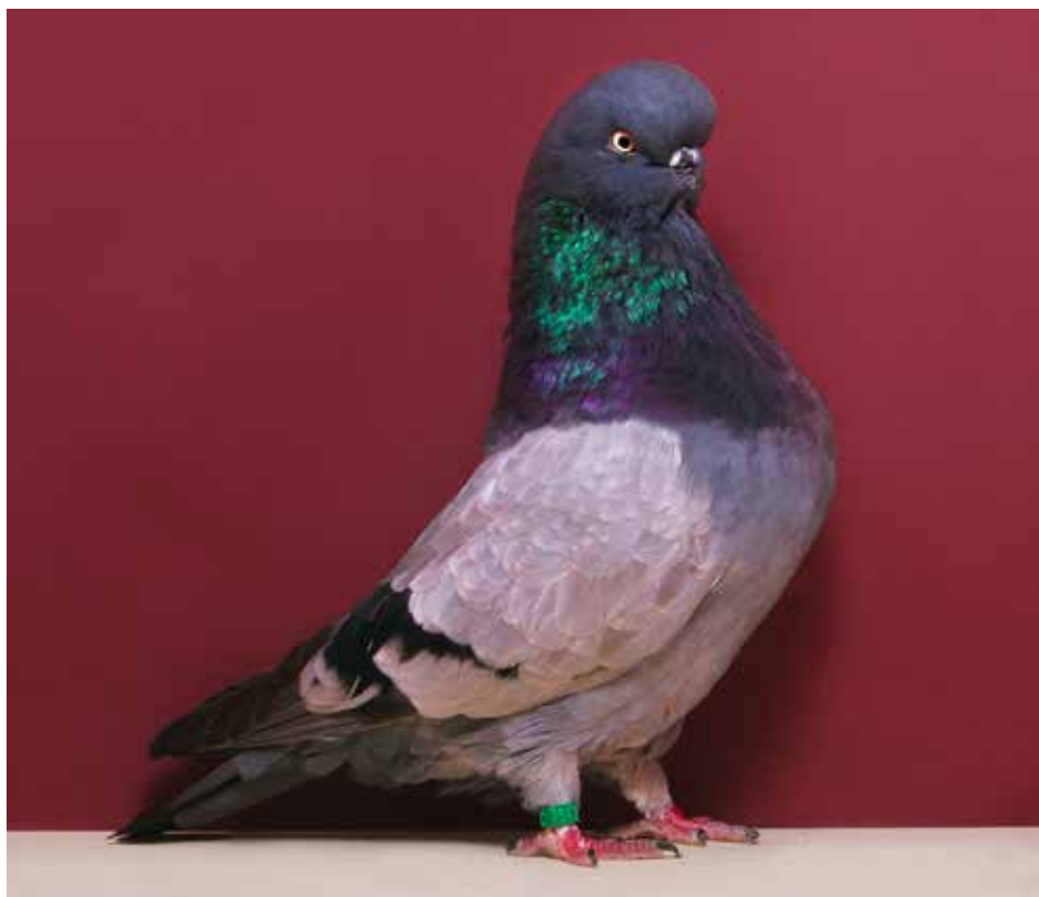
Capitombolante Inglese a faccia lunga blu vergato nero di Colin Jones - Inghilterra