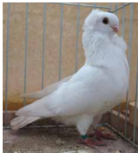
Vecchio Cravattato Tedesco bianco pt 97 di Gianni Beghetto