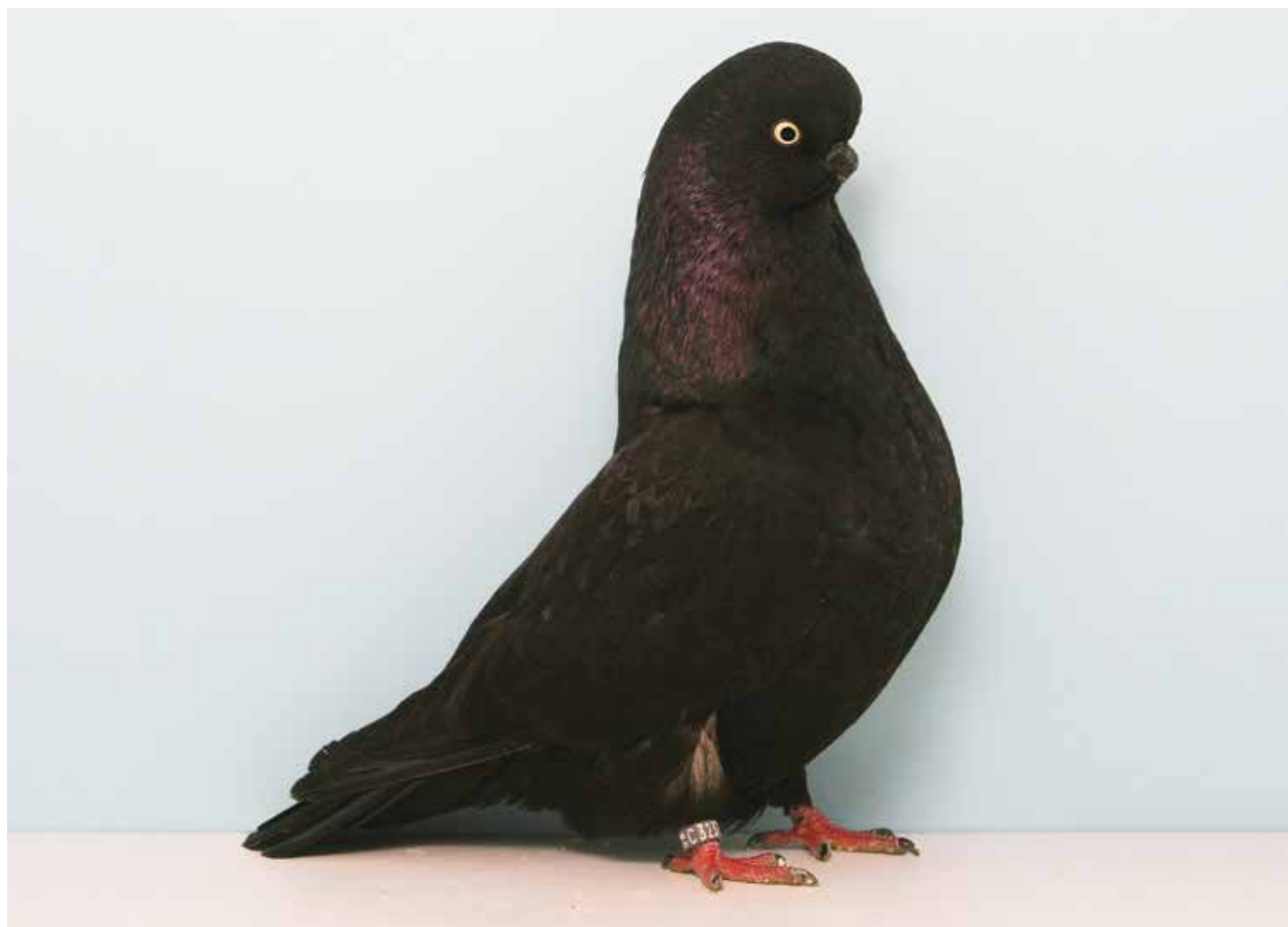
Capitombolante Inglese a faccia lunga nero di Jeffrey Krahenbring - Australia