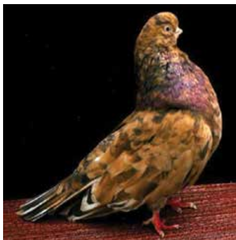
Fig. 3: Capitombolante Inglese a Faccia Corta almond

Analizziamo ora il fenotipo almond classico tipico del Capitombolante