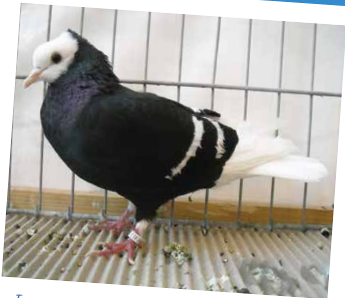
Turgoviese monacato nero vergato bianco F pt 97 di Kunz Heini - CH