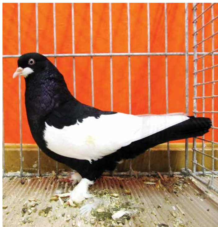
Capitombolante rumeno pica barbuto nero