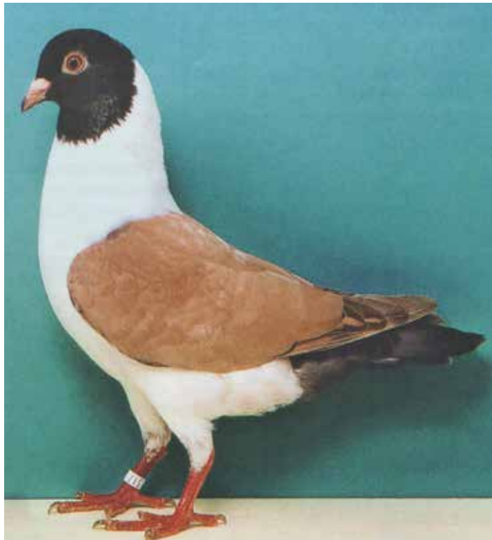
Triganino Modenese gazzo pietrascura spalla gialla