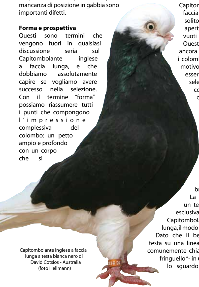
Capitombolante Inglese a faccia lunga a testa bianca nero di David Cotsios - Australia

Questi sono termini che vengono fuori in qualsiasi discussione seria sul Capitombolante inglese a faccia lunga, e che dobbiamo assolutamente capire se vogliamo avere successo nella selezione. Con il termine "forma" possiamo riassumere tutti i punti che compongono l'impressione complessiva del colombo: un petto ampio e profondo con un corpo che si