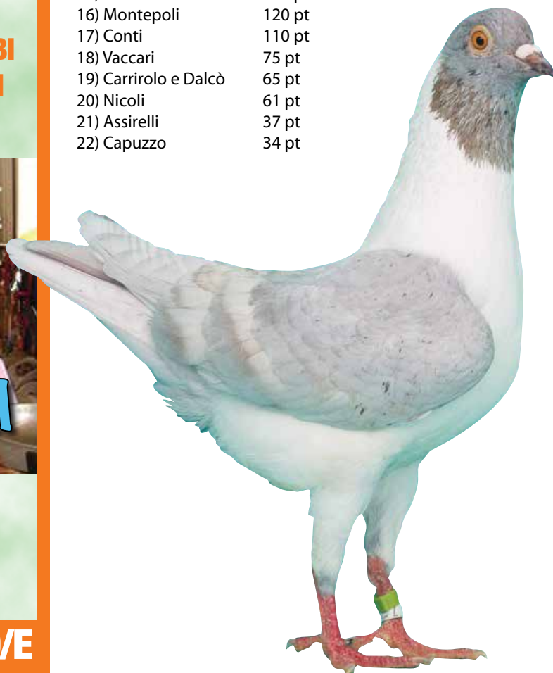
Triganino Modenese gazzo monaro argentino a verghe bianche collezione Trompetto