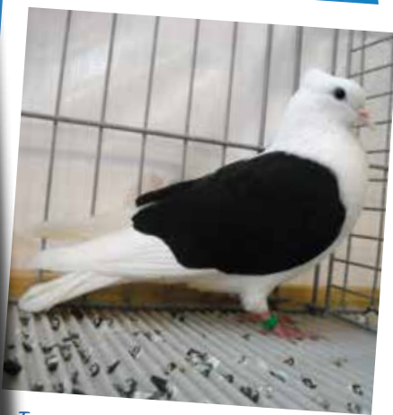
Turgoviese scudato nero F pt 97 di Eberhard Peter - D