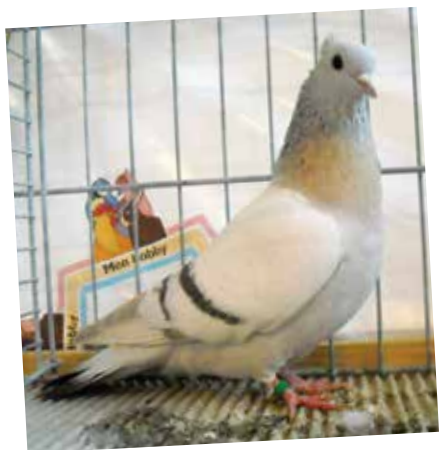
Turgoviese color farina farinoso vergato M pt 97 di Huber Paul - CH