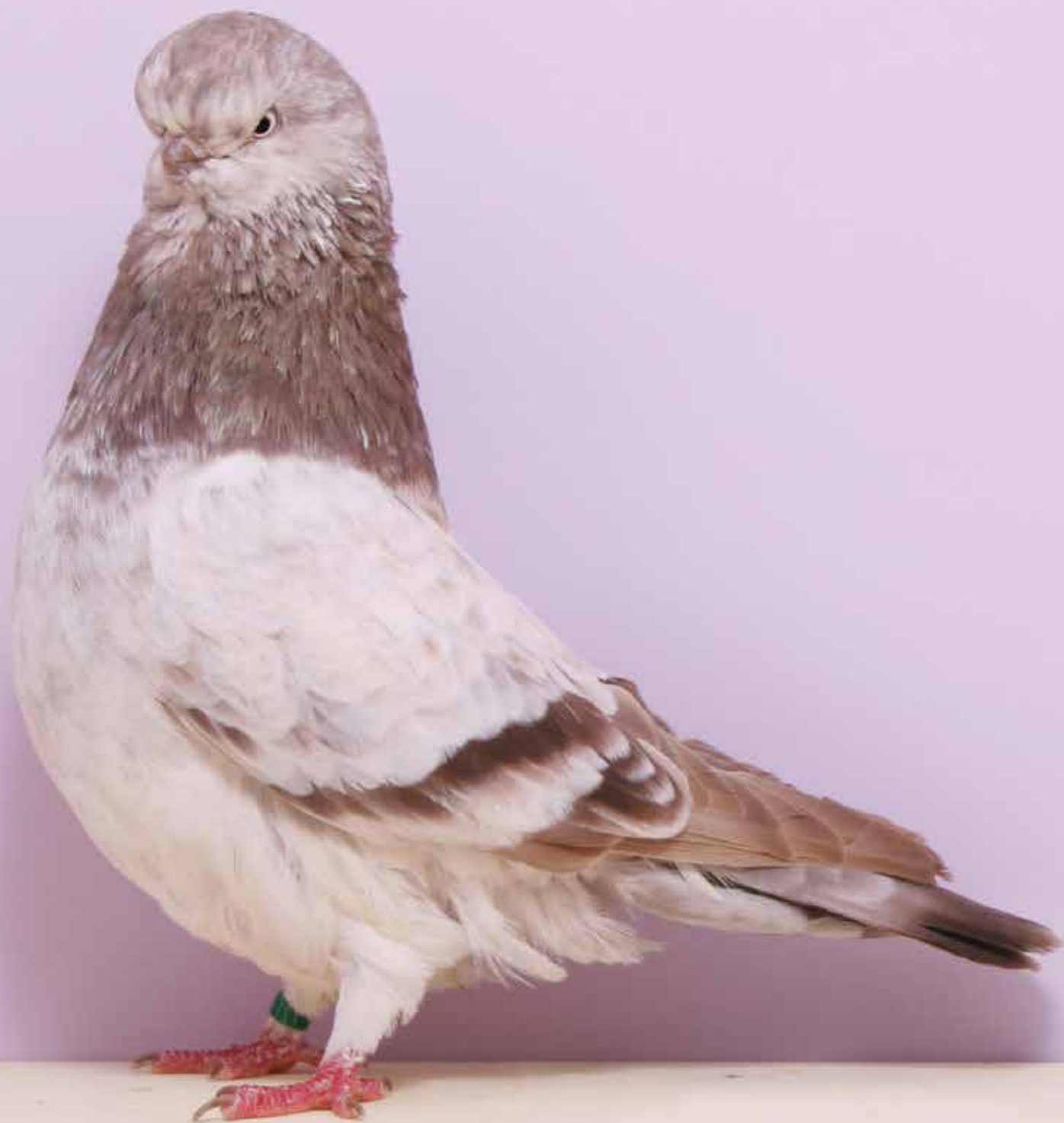
Capitombolante Inglese a faccia lunga zarzano bruno di Colin Jones - Inghilterra