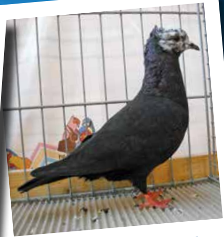
Bernese a testa mazzata nero F pt 97 di Uebersax Christoph - CH