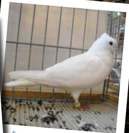
Svizzero unicolore bianco F pt 95 di Rüttemann Jakob - CH