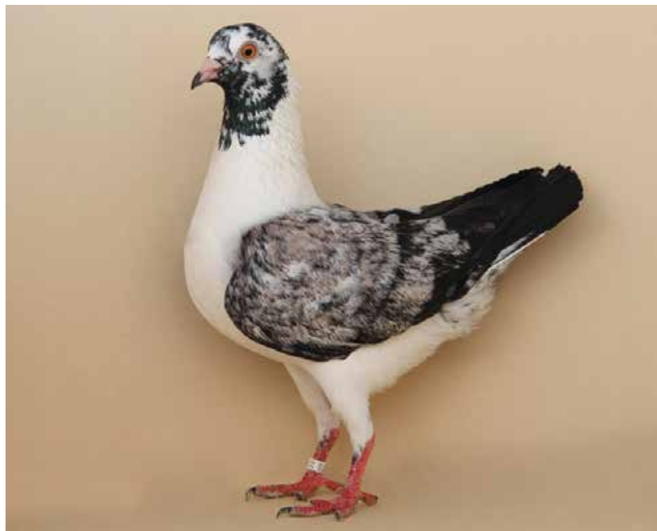
Triganino Modenese gazzo rospo argentino collezione Rossin

Il premio Cucconi per un colombo raro è stato vinto da Trompetto per un nero trigano di rosso.