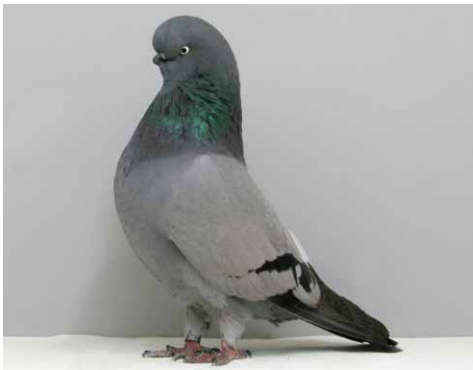
Capitombolante Inglese a faccia lunga blu vergato nero di Don Copeland - Arizona (USA)

assottiglia verso la coda, e guardiamo il colombo da sopra vediamo chiaramente una forma a cuneo. Per raggiungere questa forma ideale dobbiamo tener d'occhio