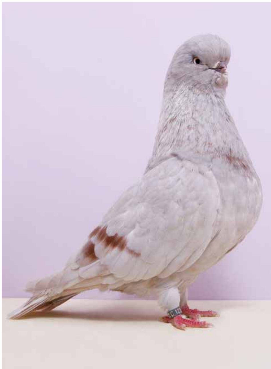
Capitombolante Inglese a faccia lunga rosso vergato di Colin Jones - Inghilterra