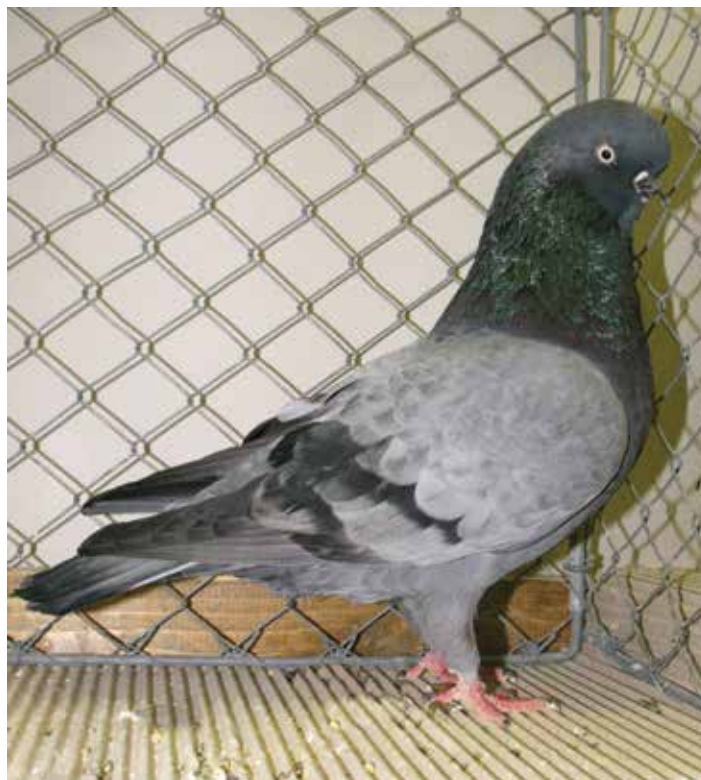
Capitombolante Inglese a faccia lunga blu vergato nero M pt 94 di Siegmund Gnap - Germania