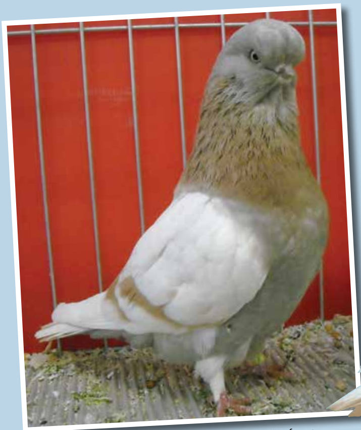
Capitombolante Inglese a faccia lunga giallo vergato F di Gianfranco Mosso