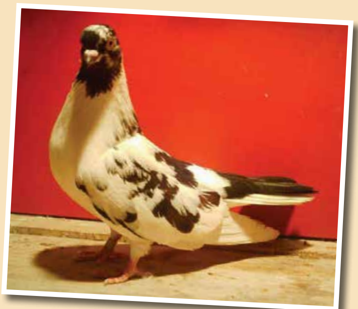
Altovolante di Ploiesti farfallato rosso