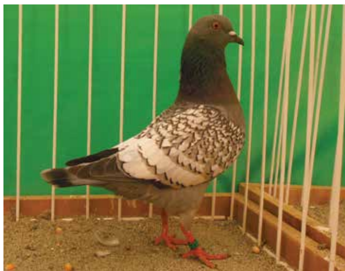
Triganino Modenese schietto triganino di bigio quadrinato bianco F cl A pt 97 di Vittoria Pellegrini

Bozzo con un bel maschio da 95,5 punti. Varietà per il signor Pavan con un soggetto da 94 punti.