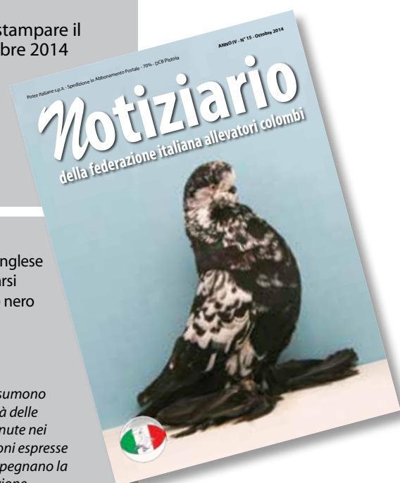
Capitombolante Inglese a faccia lunga zarzano blu, ottimo soggetto australiano

È vietata la riproduzione, anche parziale, di testi e foto contenuti nel Notiziario, senza l'autorizzazione della Federazione Italiana Allevatori Colombi®.