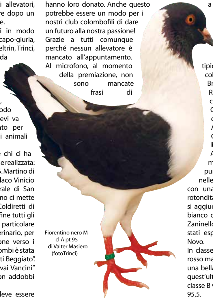
Fiorentino nero M cl A pt 95 di Valter Masiero

qualcuno stia diventando un po' oneroso. Quest'anno hanno partecipato come visitatori, nella mattinata di venerdì 25, anche i bambini della scuola primaria di San Martino di Venezze che, accompagnati dagli insegnanti, hanno ammirato razze di colombi a loro sconosciute. In questa occasione alcuni bambini sono tornati con i genitori per prendere delle coppie di colombi di piccola taglia che alcuni soci hanno loro donato. Anche questo potrebbe essere un modo per i nostri club colombofili di dare un futuro alla nostra passione! Grazie a tutti comunque perché nessun allevatore è mancato all'appuntamento. Al microfono, al momento della premiazione, non sono mancate frasi di