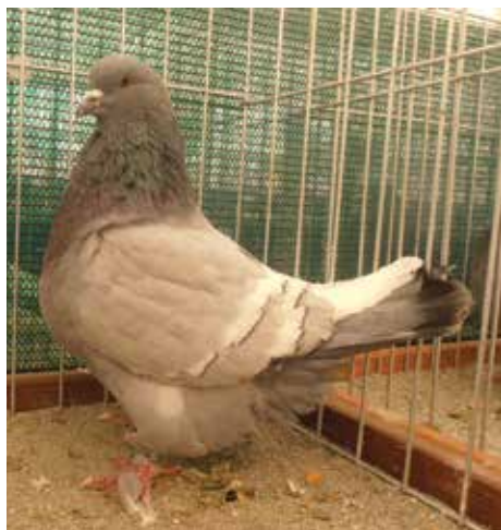
Lince di Polonia blu con verghe bianche F cl B pt 96 di Mario Bozzo

di razza in classe A un ottimo colombo blu magliato del signor Pivetti valutato 96