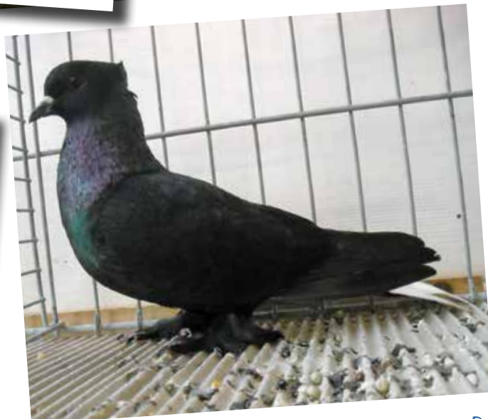
Argoviese a coda bianca nero M pt 95 di Michel Max - D

di poco distanziati i capitombolanti di Colonia con 73 unità. Inoltre vi erano i rari capitombolanti di Amburgo (raramente esposti anche in altre nazioni), i capitombolanti della Prussia orientale, le piche tedesche e molte altre razze.