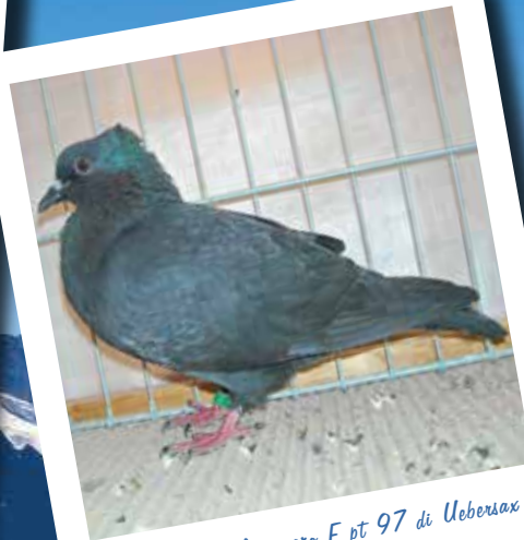
Svizzero unicolore nero F pt 97 di Ueberliax Christoph - CH