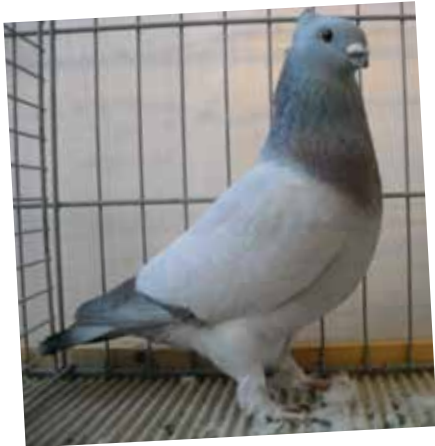
Lucernese unicolore blu F pt 93 di Kutscherauer Edmund - D