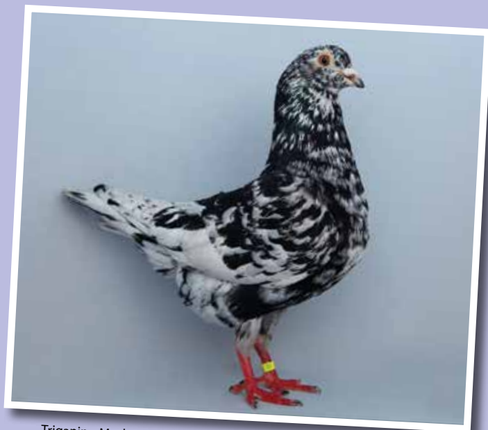
Triganino Modenese schietto magnano di nero collezione Conficoni