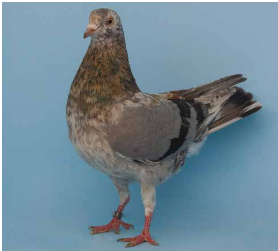
Triganino Modenese schietto magnano di pietra chiara con pezza collezione Rossin

Molto buoni i 4 brodoceci di cl. A di Belucchi con un maschio da 97 pt. Tra i 5 pietra scura a verghe gialle di cl. A una femmina di Belucchi ha ottenuto 96 pt ed un maschio di Rossin 95,5 pt ed i 2 di cl. B di Rossin 94 pt. Tra i 5 pietra gialla a verghe gialle tutti di cl. A di Trompetto un maschio ed una femmina hanno ottenuto 94 pt.