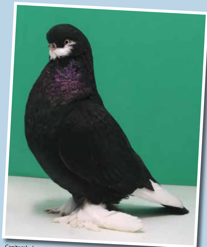
Capitombolante Inglese a faccia lunga a tarsi impiumati nero barbuto di Felice Esposito - Australia