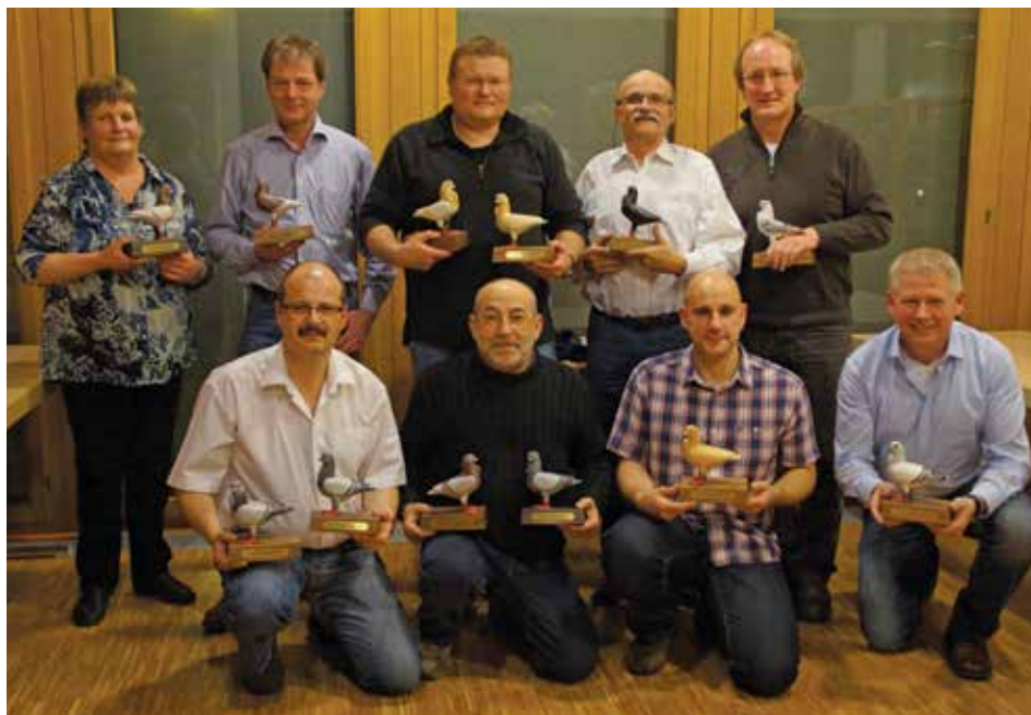
Gli allevatori vincitori del titolo europeo di rassegna

però sarà necessario in futuro prestare maggiore attenzione alla forma della testa, poiché in alcuni esemplari risultava abbondantemente arrotondata. Ralf