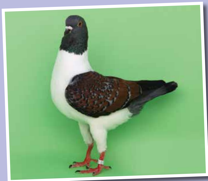
Triganino Modenese gazzo trigano di bigio quadrinato rosso collezione Verardi