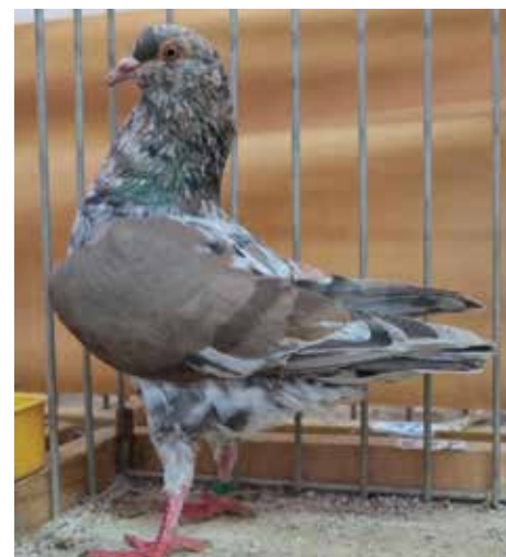
Triganino Modenese schietto magnano di bigio con pezza pt 97 di Bandiera