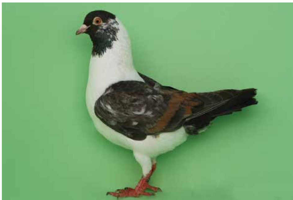
Triganino Modenese gazzo zarzano di nero a verghe rosse collezione Trompetto

Molto bella la collezione di sauri di La Valle che hanno ottenuto tra i 3 di cl. A 97 pt con un maschio e tra i 6 di cl. B 95 pt sia con un maschio che con una femmina. L'esordiente Marchetto ha presentato i caldani: tra i 7 di cl. A sia un maschio che una femmina hanno ottenuto 95,5 pt ed in cl. B una femmina 95,5 pt ed un maschio 94 pt. I neri di cl. A erano 13 con vittoria di Bisi sia con un maschio da 95 pt che con una femmina da 94 pt davanti a Panizzi con 94,5 pt e Nicoli e Reggiani con