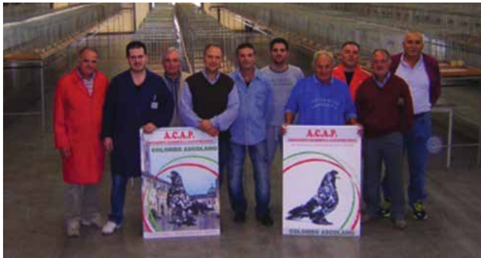
Soci A.C.A.P. ed amici al lavoro per l'allestimento della 29 a Mostra Colombofila.

C i siamo! Anche il conto alla rovescia per la 29 a Mostra Colombofila Picena, si è concluso e materializzato nelle giornate del 19-20 Ottobre 2013 presso il Centro Fieristico di Villa Potenza a Macerata.. Quest'anno è stato pieno di impegni a volte onerosi, ma alla fine resi sempre piacevoli dalla volontà sia del sottoscritto che di tutti quei soci a non tirarsi mai indietro e dalla vicinanza di amici e collaboratori che al primo cenno sono al nostro fianco. Con immenso orgoglio che riaffermo che è questa l'A.C.A.P. che piace a me. Se il 2013 è stato pieno di impegni il 2014 non sarà da meno, per prima cosa dobbiamo realizzare il libro già deliberato che racconta la nostra storia dalla sua costituzione ad oggi. Stiamo cercando di riesumare tutto