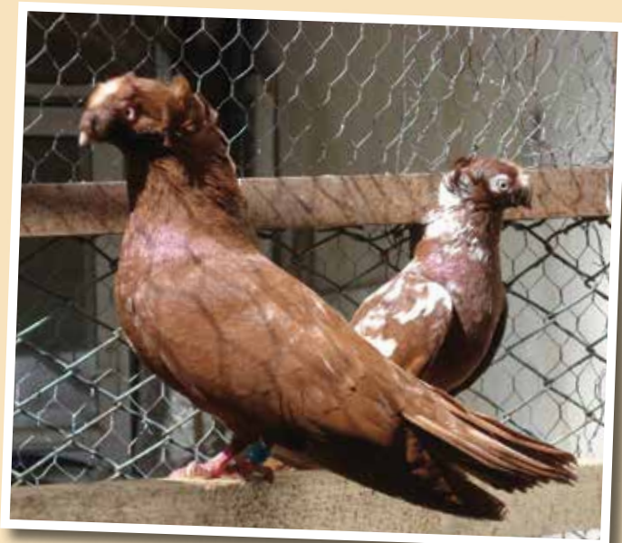
Capitombolante di Calarasi rosso e tigrato rosso