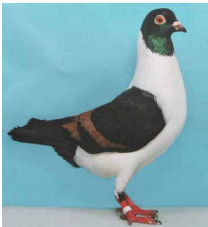
Triganino Modenese gazzo nero a verghe rosse