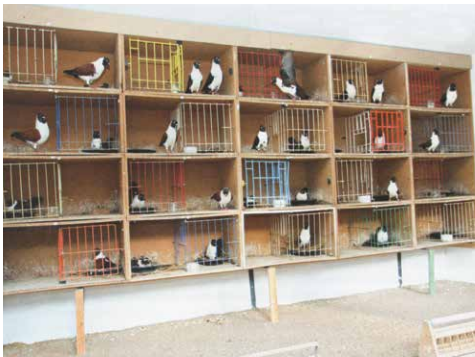
La colombaia della famiglia Bechstein

Il Triganino Modenese Gazzo è una razza di colombi affabili e facili da allevare. Il loro essere prolifici e l'affidabilità durante la cova e l'allevamento sono qualità che li rendono attraenti. Dove esistono i presupposti per allevare dei colombi, se un allevatore ha il piacere di creare e sperimentare giochi di colore, non rimarrà di certo deluso da questi particolari animali. Questo è il riassunto del messaggio che i due padroni di casa mi hanno voluto trasmettere al termine del nostro incontro, prima di congedarsi da me. Con questo articolo vorrei adempiere alla promessa che avevo fatto loro di raccontare