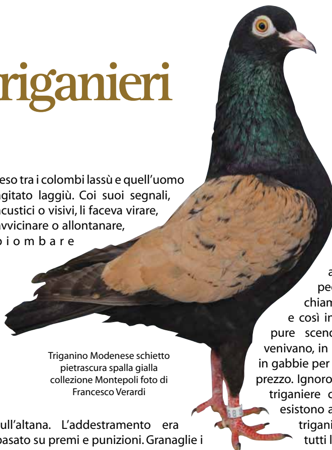
Triganino Modenese schietto pietrascuro spalla gialla collezione Montepoli

teso tra i colombi lassù e quell'uomo agitato laggiù. Coi suoi segnali, acustici o visivi, li faceva virare, avvicinare o allontanare, p i o m b a r e