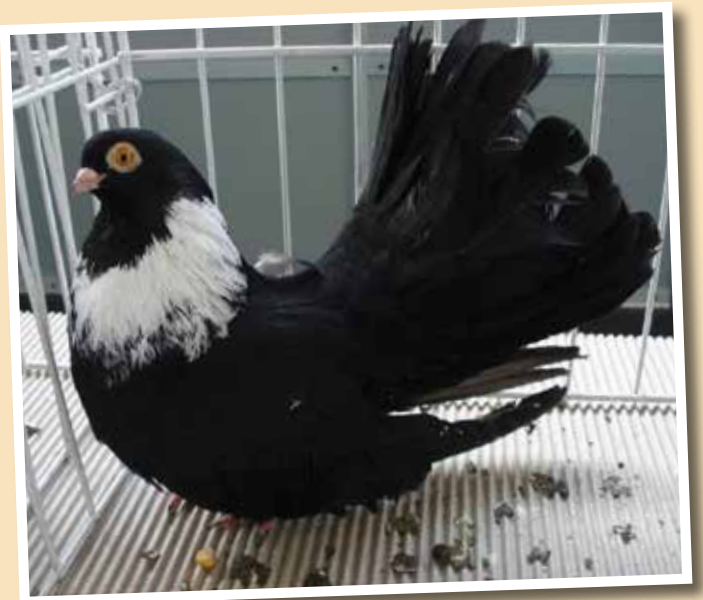
Capitombolante nero di Bucarest