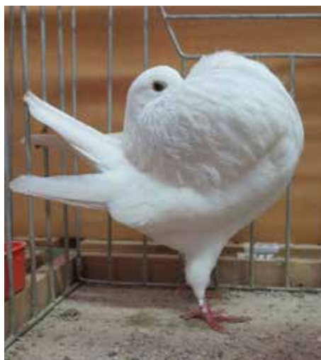
Gozzuto di Amsterdam bianco pt 96 di Agostino Gallio