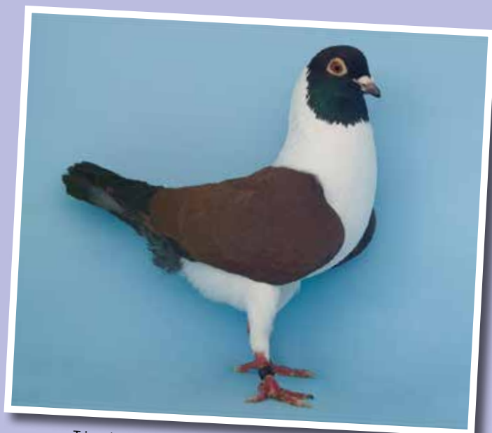
Triganino Modenese gazzo covro collezione Sanlazzaro