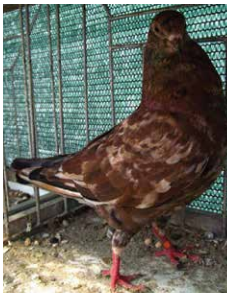
Fig. 4: Triganino Modenese magnano di pietrarossa

La sua formula genetica è la seguente: Tutti questi caratteri messi insieme danno la colorazione almond classica. Anche il gene zarzano (G) sembra avere un ruolo nella composizione del