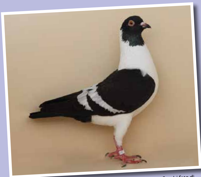
Triganino Modenese gazzo nero a verghe bianche collezione Sgarbi