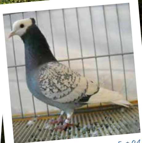
Turgoviese monacato blu magliato bianco F pt 94 di Braun Hans - CH