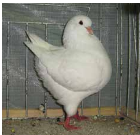
king bianco pt 96.5 di Leoni Felice