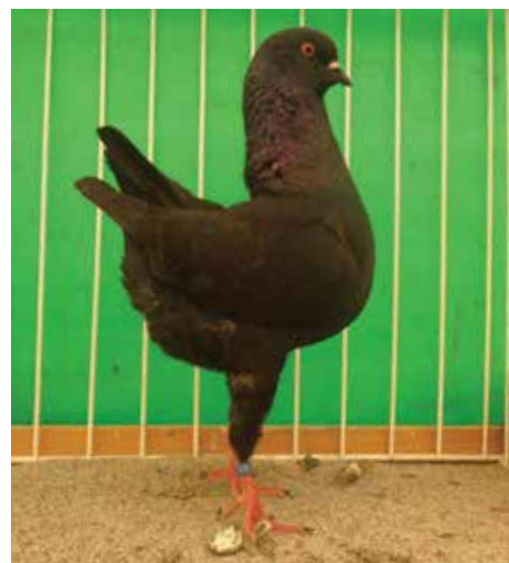
Modenese Tedesco schietto nero F cl B pt 97 di Giuliano Braghin

Ricciuto: 5 presentati la prima volta alla