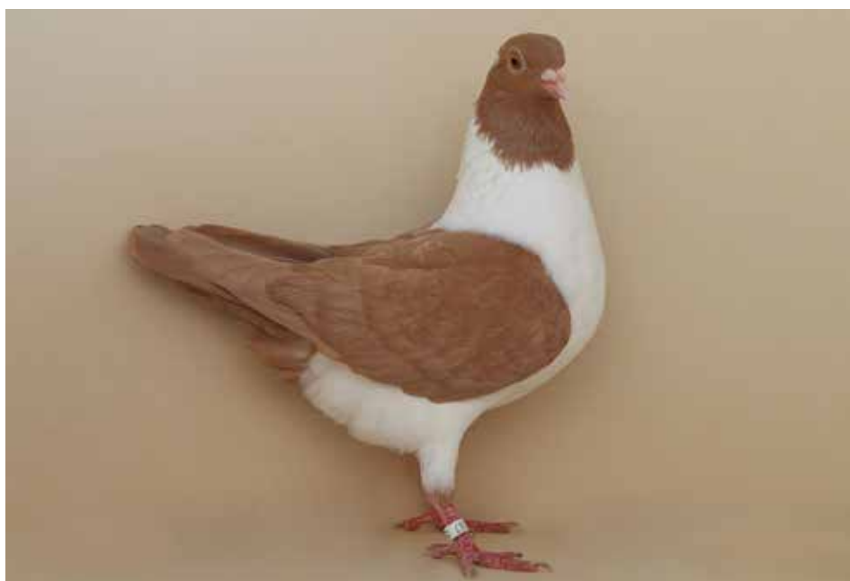
Triganino Modenese gazzo caldano collezione Bartoletti

Con i 5 pietra chiara a verghe bianche di cl. A Novo ha ottenuto 94 pt sia con un maschio che con una femmina. Nei 5 smagliati di cl. A Sgarbi ha vinto con una femmina da 96,5 pt ed un maschio da 96 pt davanti a Novo con 95 pt. Tra 6 pietra chiara a verghe rosse di cl. A Vaccari ha presentato un maschio da 96 pt e Novo una femmina da 95 pt. Nei 3 neri a verghe rosse di cl. A Dalcò ha realizzato 96 pt con una femmina; nei 2 neri fioccati di rosso di cl. A lo stesso Dalcò ha ottenuto 94 pt. Tra 2 bigi a verghe rosse una femmina di Goletto ha ottenuto 96 pt. I bigi trigani di bianco di Novo erano 5 in cl. A con un maschio ed una femmina da 97 pt ed uno in cl. B da 96,5 pt. I pietra chiara trigani di bianco di Novo erano uno in cl. A con 96,5 pt e due in cl. B con una femmina da 97 pt. Trompetto ha presentato 5 neri trigani di rosso in cl. A con una femmina da 94 pt; lo stesso Trompetto tra 3