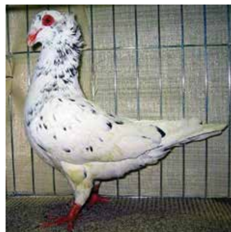
Fig. 2: Sottobanca magnano

importante per la formazione del magnano tipico, riscontrato nei soggetti neri con penne bianche quasi sempre localizzate sulla testa, detti suore o preti. Il gene responsabile di queste piume bianche appartiene alla famiglia dello zarzano e non è chiaro se si tratti di questo stesso gene o di una sua variante. La sua interazione con il magnano potrebbe essere responsabile di questo