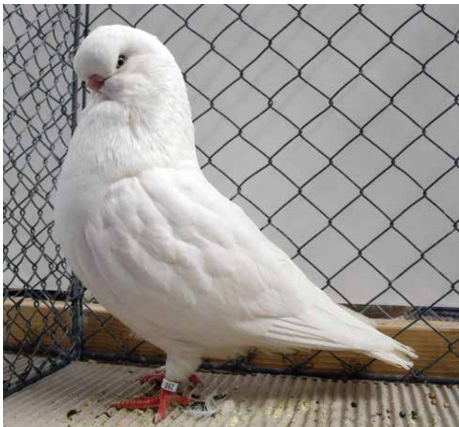
Capitombolante Inglese a faccia lunga bianco F pt 96 di Hans-Ulrich Bachmann - Germania

Dal parlare del becco al parlare della testa il passo è breve. La testa ideale è di forma circolare, paragonabile a una pallina da golf. E anche qui la sfida è dietro l'angolo: mantenere una sufficiente altezza del piumaggio sopra l'occhio per ottenere il profilo circolare desiderato. Non fatevi ingannare dalle immagini: il volume della testa di un moderno Capitombolante inglese a faccia lunga è prima di tutto fatto di piume. Anni di allevamento selettivo, guidato dalle indicazioni di giudizio, hanno modificato la struttura della piuma facendola crescere verso l'alto anzichè lungo le linee reali del cranio. Proprio sopra il becco le piume dovrebbero crescere un po' in avanti fino a sovrastarlo e superarlo; più avanza il profilo frontale però, più difficile sarà mantenere l'altezza necessaria sulla testa per realizzare il profilo circolare. Capita spesso di vedere dei "faccia lunga" ai quali manca l'altezza del piumaggio sopra l'occhio; questo dà l'impressione di un cranio piatto e fa sembrare la testa