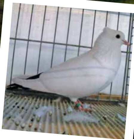
Wiggentaler a coda colorata blu F pt 94 di Braun Hans - CH