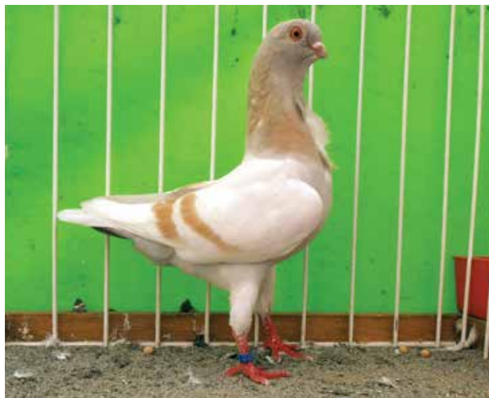
Cravattato Italiano Reggiano giallo vergato F cl B pt 95.5 di Novo Giampaolo